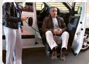
Ein- und Aussteigeihlfen